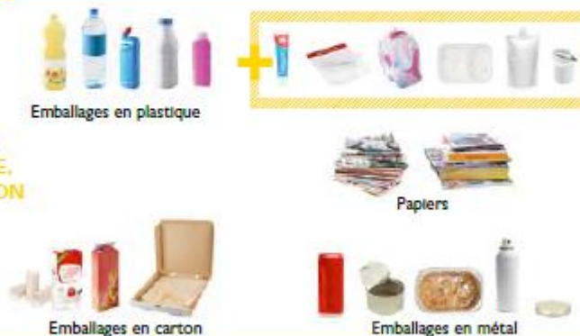
Emballages en plastique

TOUS LES EMBALLAGES EN PLASTIQUE, MÉTAL, CARTON ET TOUS LES PAPIERS